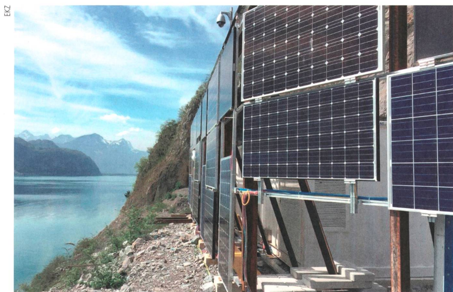
Seit Januar misst die temporäre Testanlage bis Frühjahr 2016 Stromerträge und Klimaverhältnisse.