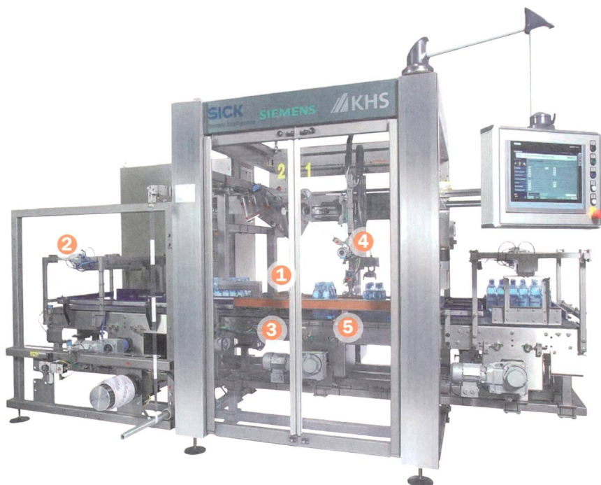
Bild 2 Anlage zum Anbringen eines Tragegriffs an unterschiedliche Sixpack-Gebinde mit intelligenten Sensoren.

positionieren, identifizieren und sichern ab. Sie verfügen über eine Überwachungsfähigkeit. Damit ist eine vorausschauende Wartung mit genauem Wartungsplan möglich. Zudem verfügen Sensoren über eine zuverlässige Selbstdiagnose und lassen sich im Störfall schnell und einfach austauschen.