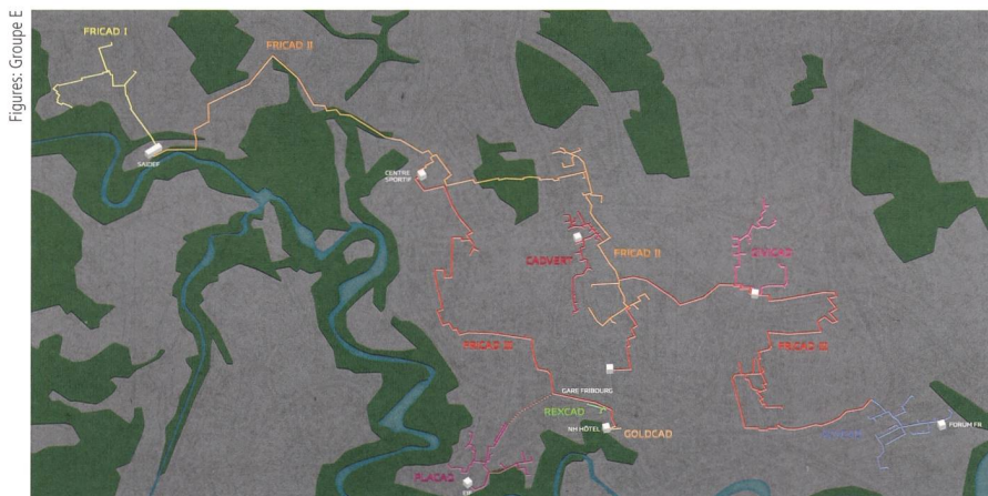
Figure 3 Après extension, le réseau Fricad totalisera 40 kilomètres de conduites CAD.

La turbine à air chaud Fernwärme Düringen fait partie des premiers projets en Suisse inscrits au « programme phare » de l'OFEN. Ces projets utilisent des tech-