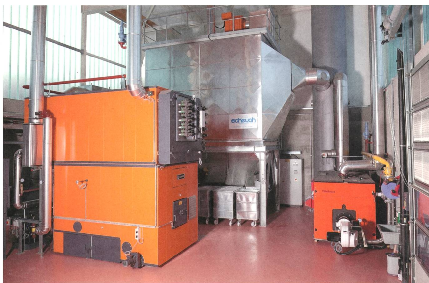
Figure 1 La combustion de plaquettes de bois dans une chaudière permet de valoriser une énergie renouvelable et locale.

Le chauffage à distance La Tour-de-Peilz permet de produire de l'énergie d'une manière particulièrement respectueuse de l'environnement. À part son passage dans des filtres, l'eau du lac n'est pas traitée et sa qualité reste inchangée.