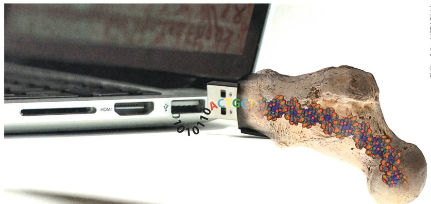
Philipp Stosse/ETH Zürich

DNA zurückgreifen. Daraus errechneten sie ihre Prognose: Bei Lagerung bei tiefen Temperaturen, wie zum Beispiel im weltweiten Saatgut-Tresor auf Spitzbergen bei -18^{\circ}\text{C} , könnte die DNA-kodierte Information über 1 Mio. Jahre überdauern. Im Vergleich dazu lassen sich Daten auf Mikrofilm «nur» für etwa 500 Jahre bewahren. No