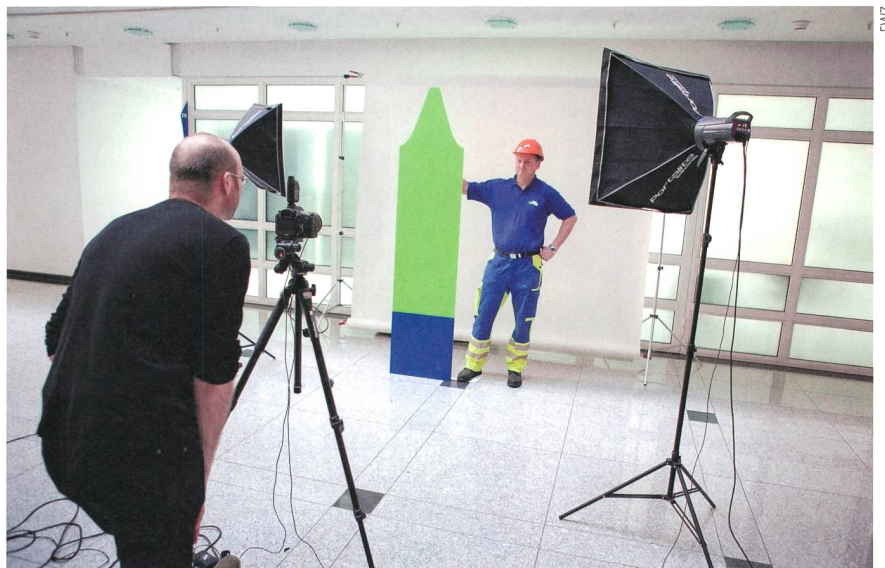
EWZ-Mitarbeiter beim Fotoshooting für den Arbeitgeberauftritt.

Best Recruiters ist die grösste Recruiting-Studie im deutschsprachigen Raum. Sie wird vom Career-Verlag durchgeführt und untersucht die Recruiting-Qualität der Top-Arbeitgeber Deutschlands, Österreichs und seit 2013/2014 auch der Schweiz anhand aktueller Standards und Trends im Personalbereich. Die Schweizer Studie wird von der Zürcher Hochschule für Angewandte Wissenschaften (ZHAW) wissenschaftlich begleitet. Analysiert wurden 510 Schweizer Arbeitgeber in insgesamt 26 verschiedenen Branchen. Für die Teilnahme fallen keine Gebühren an. Die Bandbreite der Untersuchungsmethoden reicht von Spontanbewerbungen über Testanrufe bis zur Analyse der Online-Präsenz.