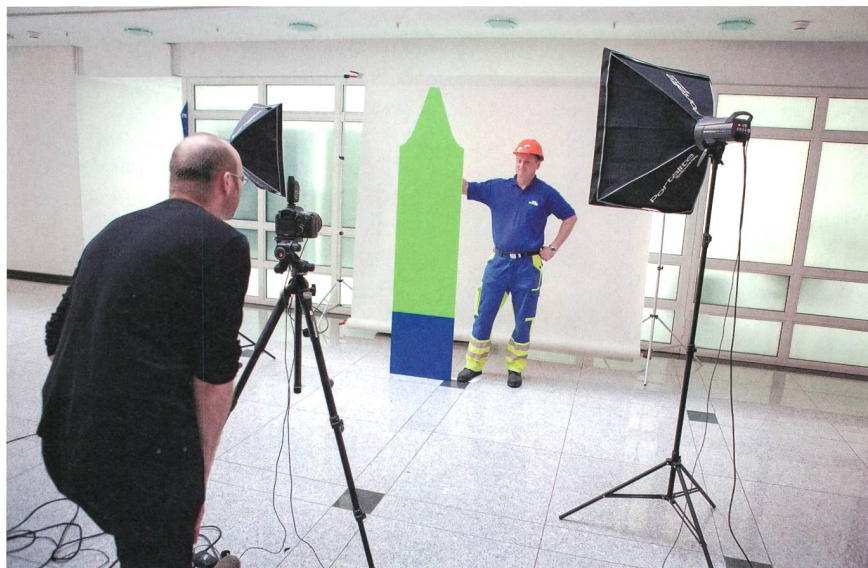
EWZ-Mitarbeiter beim Fotoshooting für den Arbeitgeberauftritt.

Best Recruiters ist die grösste Recruiting-Studie im deutschsprachigen Raum. Sie wird vom Career-Verlag durchgeführt und untersucht die Recruiting-Qualität der Top-Arbeitgeber Deutschlands, Österreichs und seit 2013/2014 auch der Schweiz anhand aktueller Standards und Trends im Personalbereich. Die Schweizer Studie wird von der Zürcher Hochschule für Angewandte Wissenschaften (ZHAW) wissenschaftlich begleitet. Analysiert wurden 510 Schweizer Arbeitgeber in insgesamt 26 verschiedenen Branchen. Für die Teilnahme fallen keine Gebühren an. Die Bandbreite der Untersuchungsmethoden reicht von Spontanbewerbungen über Testanrufe bis zur Analyse der Online-Präsenz.