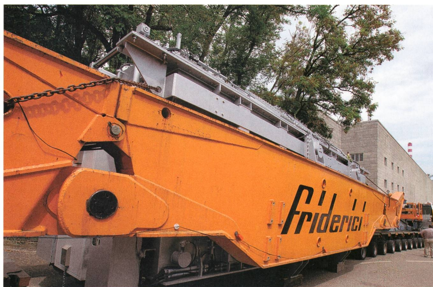
Figure 3 Arrivée du transformateur.

Quoi qu'il en soit, des solutions doivent être trouvées puisqu'un câble arraché n'est pas qu'une simple interrup-