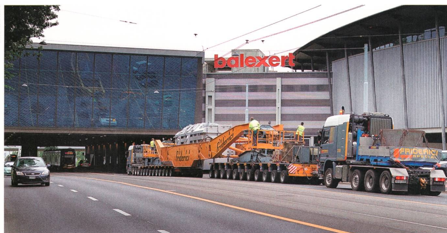
Figure 2 Transport du nouveau transformateur vers le site de Verbois.

transformation, construit en 1974, constituée avec Verbois l'une des deux « portes d'entrée » de l'électricité à très haute tension (220 kV) importée sur le réseau genevois.