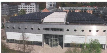
Tagungsort «Tiergarten»: PV-Labor Berner Fachhochschule, Jlcoweg 1, in Burgdorf

Fachtagung Freitag, 21. November 2014, von 9.30 bis 17.00 Uhr des PV-Labors der Berner Fachhochschule in Burgdorf