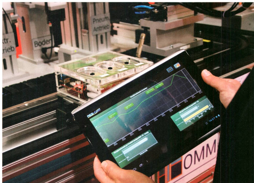
Anzeige des aktuellen Energieverbrauchs auf Tablet.

Die Produktionsanlage der DFKI-SmartFactory KL zeigt die Realisierbarkeit diverser Kernaspekte von Indust-