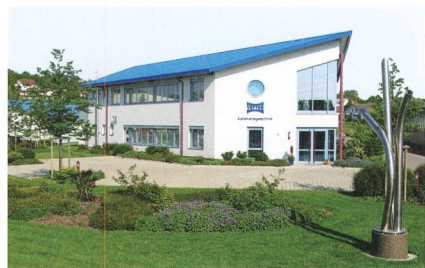
Mutterhaus der Vetter Plumett AG.

Ecofort GmbH, Birkenweg 11, 2560 Nidau Tel. 032 322 31 11, www.ecofort.ch