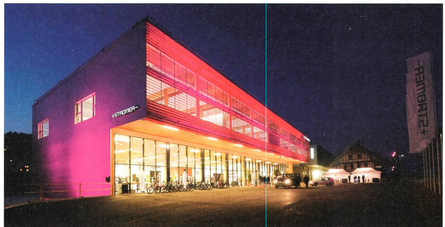
Am Stromer-Campus bei Bern wird geforscht, entwickelt, montiert und verkauft.

Ausprobieren kann man den Stromer ausserdem an der ITG/ETG-vor-Ort-Veranstaltung am 21. Mai 2014 auf dem Stromer-Campus in Oberwangen bei Bern. Für weitere Details: www.electrosuisse.ch/itg . No