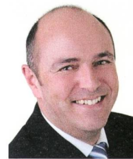
MCH Messe Basel