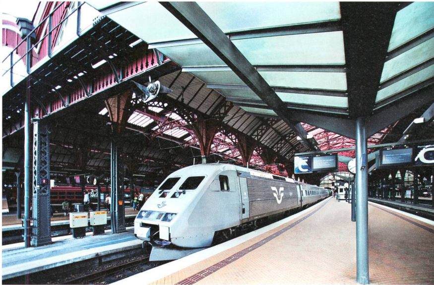
Die schwedischen Hochgeschwindigkeitszüge.

Die ersten auf- und nachgerüsteten Züge werden 2015 ausgeliefert. Nach dem erfolgreichen Abschluss der Test- und Evaluierungsphase erfolgt bis 2019 die schrittweise Modernisierung der restlichen Züge. No