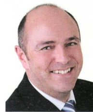
MCH Messe Basel