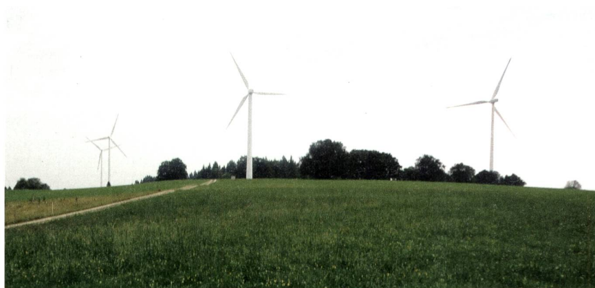
Die Anwohner der Windenergieanlagen auf dem Mont Crosin wurden in der Studie ebenfalls befragt.

Simon Eberhard ist Chefredaktor VSE des Bulletin SEV/VSE. simon.eberhard@strom.ch