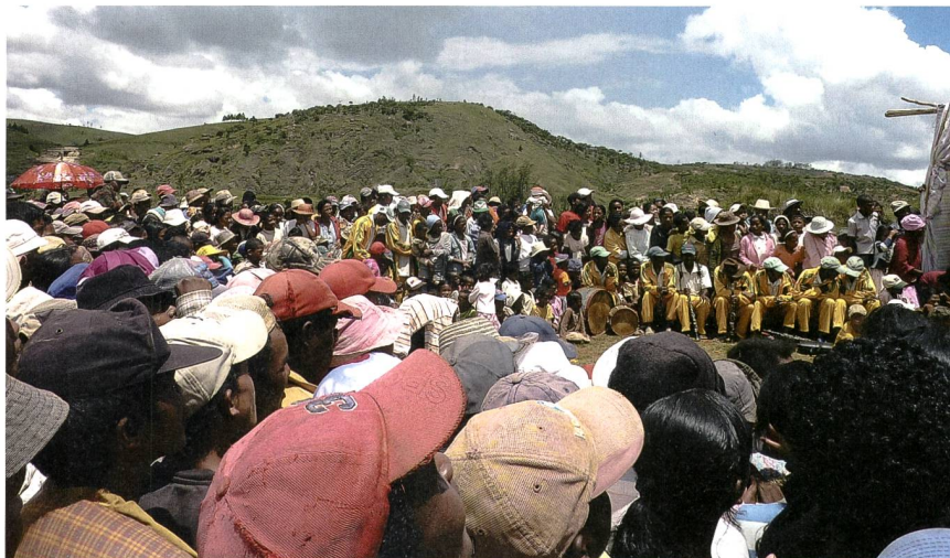
Figure 2 Introduction du projet lors d'une fête organisée par les villageois bénéficiaires du projet pico-Andriambola.