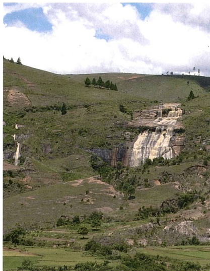
Figure 1 Chute d'Andriambola.

Outre le Cicafe (Centre d'Information, de Communication, d'Animation, de Formation et d'Éducation, une ONG locale), les villageois et les opérateurs privés