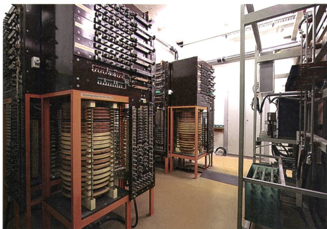
Bild 3 Induktivitäten zur Wirkfaktorsteuerung des Prüfstroms.