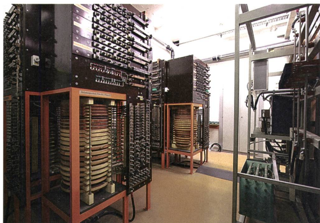
Bild 3 Induktivitäten zur Wirkfaktorsteuerung des Prüfstroms.

sowie eine Klimaanlage zur Kühlung der elektronischen Aggregate sind weitere wichtige Komponenten der neuen Anlage. Das Aktivfilter erzeugt durch die Leistungselektronik und die Ankopplungs-drosseln Verlustleistung in Form von Abwärme, welche durch die Klimaanlage entsprechend abgeführt werden muss.