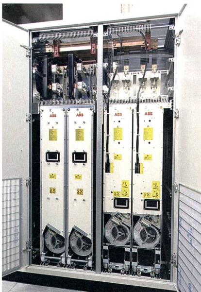
Bild 1 Einer von vier Schränken der Leistungselektronik.