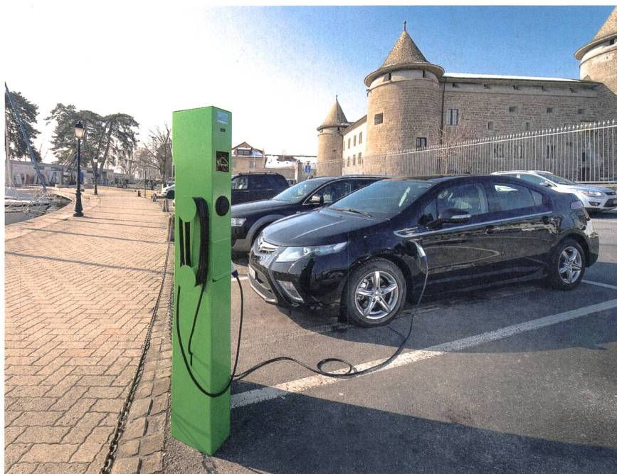
Figure 3 Places de parc publiques équipées d'une borne de recharge.

■ fournir une puissance de recharge par véhicule allant de 3,7 à 44 kW (1,8 kW pour les scooters) en fonction des possibilités et des coûts de raccordement pour l'opérateur de la borne ;