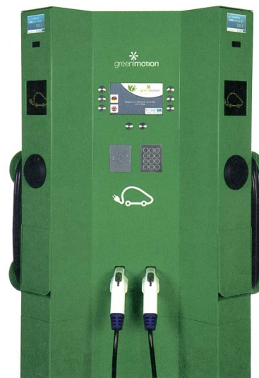
Figures: Green Motion

Ainsi, à titre d'exemple, alors que Green Motion propose une gamme de bornes allant de la recharge à 3,7 kW à celle à 44 kW, seuls 10 % des bornes installées entre 2010 et 2012 étaient conçues pour une recharge supérieure à 3,7 kW. En 2013, les bornes permettant une recharge jusqu'à 22 kW représentent