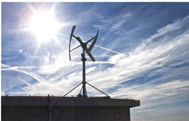
HTW Berlin/Friederike Coenen

Kostenloser Download: www.kleinwind.htw-berlin.de