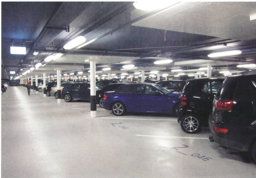
Bild 2 Parkebene 2 mit FL-Leuchten zu Testzwecken. Anschliessend wurden LEDs installiert.

Das Parkhaus ist mit 10 E-Tankstellen ausgerüstet. Diese Ladesäulen befinden sich zurzeit in der Testphase. Sie können