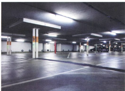
Bild 3 Parkhaus vor der umfassenden Sanierung.