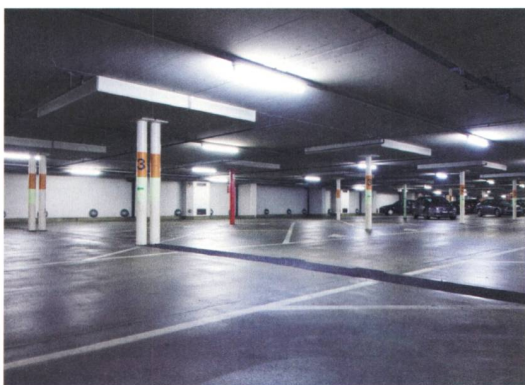
Bild 3 Parkhaus vor der umfassenden Sanierung.