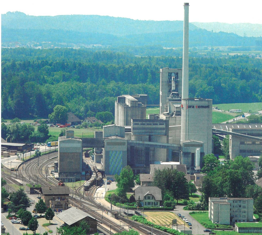
Aussenansicht des Zementwerks Wildegg der Jura Cement: Jährlich sollen 14 400 MWh Strom gewonnen werden.

Die Verfahrenstechnik der Wärmerückgewinnungsanlage in Wildegg lässt sich – analog gängiger ORC-Anlagen – grundsätzlich in drei Bereiche unterteilen: In der Wärmeauskopplung wird dem Industrieprozess mittels eines Wärmetauschers Wärmeenergie entzogen. Im Fluidkreis findet die eigentliche Energieumwandlung von der Wärmeenergie in elektrische Energie statt. Dazwischen liegt der Zwischenkreis, welche die beiden Bereiche über Rohrleitungen miteinander verbindet.