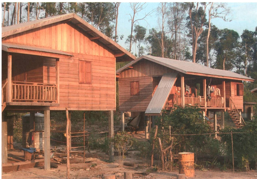
Neue Häuser im Rahmen der Umsiedlungen für das Nam-Theun-2-Projekt.

Dämmen kamen die Forscher zum Resultat, dass nur Bevölkerungsschichten, die bereits vor der Umsiedlung Zugang zu Kapital hatten, am neuen Ort eine Chance auf ein besseres Leben haben.