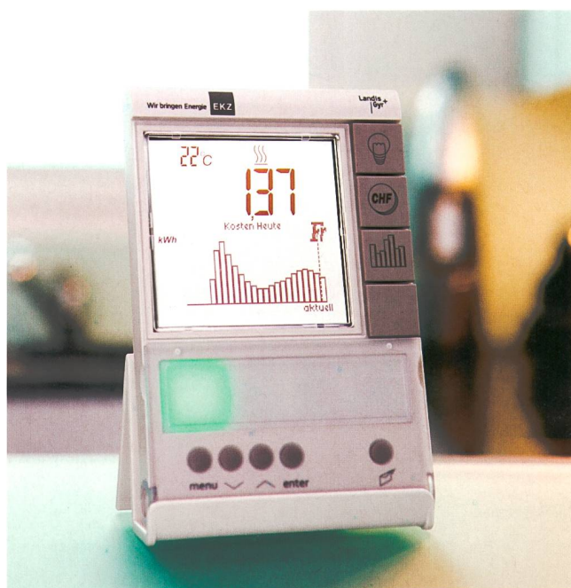
Am grössten ist der Spareffekt, wenn die Konsumenten den Verbrauch direkt sehen.