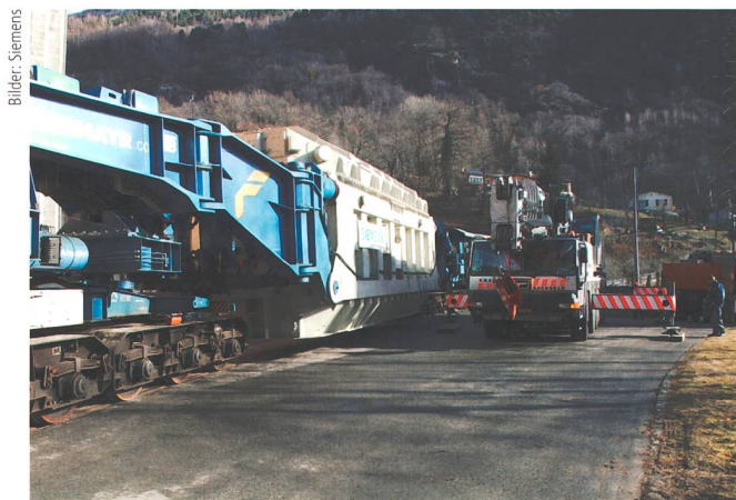
Bild 2 Wegen des hohen Gewichts konnten die Transporte nicht auf der Strasse erfolgen. Der Bahntransport war der grösste und schwerste, der jemals durch den Gotthardtunnel gerollt ist.

bezüglich Masse und Gewicht einhalten zu können. Die alten 600-MVA-Phasenschieber-Transformatoren wurden mit zwei Kesseln pro Phase gebaut – mit Transformator- und Regel-Einheit in separaten Kesseln à je rund 90 t. Es ist anzunehmen, dass diese Grösse der maximal zulässigen Transportgrösse entsprach. Die Siemens-Ingenieure entschieden sich hingegen für eine Ein-Kessel-Variante, bei welcher sich Transformator- und Regeleinheit für eine Phase im gleichen Kessel befinden. Die zwei Aktivteile sind hintereinander angeordnet, und jeder verfügt über einen Laststufenschalter für die Wahl des Regelbereiches.