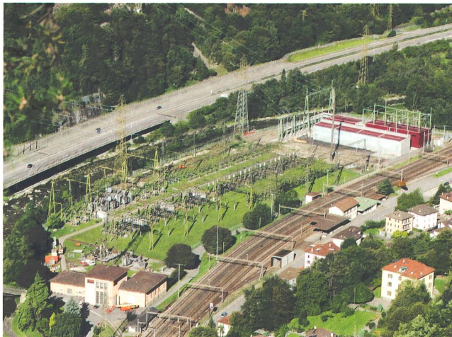
Bild 1 Die Schaltanlage Lavorgo spielt für die Zukunft des Schweizer Hochspannungsnetzes eine wichtige Rolle: Zunächst auf der Nord-Süd-Achse und später auch in der 380-kV-Ost-West-Achse von Frankreich bis nach Italien.

Die Transformatoren wurden im Innern extrem optimiert, um die Vorgaben