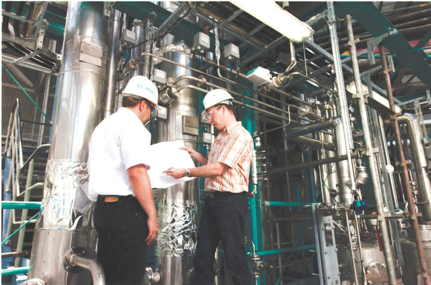
Une installation pilote de captage du CO 2 a été mise en service dans la centrale électrique Eon Staudinger à Grosskrotzenburg près de Hanau (Allemagne) sur la base du procédé PCC développé par Siemens.

gétique, consommation, moindre perte de la substance de nettoyage utilisée et coûts d'exploitation à long terme. Les autres objectifs de développement étaient l'intégration optimale du procédé dans la production d'électricité ou de chaleur de la centrale, ainsi que la flexibilité d'exploitation, et surtout d'apporter la preuve de la compatibilité écologique de la substance de nettoyage utilisée.