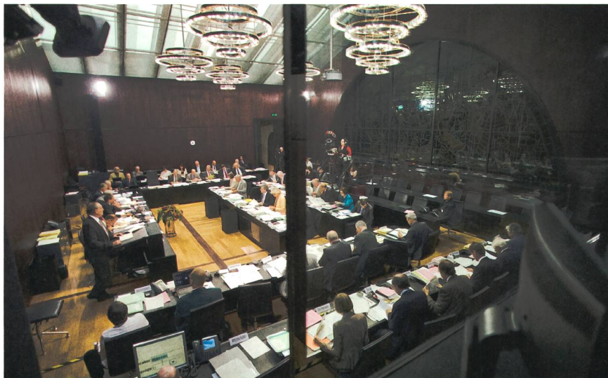
Beratungen des Ständerates in der Herbstsession 2011. Die kleine Kammer tagte wegen Renovationsarbeiten nicht im üblichen Ratssaal.

Der VSE begrüsst, dass sich auch der Ständerat gegen ein vorzeitiges Abschalten der bestehenden Kernkraftwerke aus politischen Gründen ausgesprochen hat. Dies verlängert den Zeitraum für die Suche nach einer Lösung für die absehbare Versorgungslücke. Gleichzeitig verlangt der VSE, dass das Volk das letzte Wort über die Ausrichtung der künftigen schweizerischen Energiepolitik haben muss. Mn