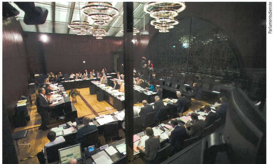
Beratungen des Ständerates in der Herbstsession 2011. Die kleine Kammer tagte wegen Renovationsarbeiten nicht im üblichen Ratssaal.

Der VSE begrüsst, dass sich auch der Ständerat gegen ein vorzeitiges Abschalten der bestehenden Kernkraftwerke aus politischen Gründen ausgesprochen hat. Dies verlängert den Zeitraum für die Suche nach einer Lösung für die absehbare Versorgungslücke. Gleichzeitig verlangt der VSE, dass das Volk das letzte Wort über die Ausrichtung der künftigen schweizerischen Energiepolitik haben muss. Mn