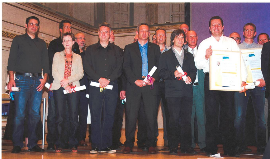
Auszeichnung: Vertreter von neuen und rezertifizierten Energiestädten mit ihren Urkunden.

Gemäss Angaben von EnergieSchweiz für die Gemeinden haben die Energiestädte im Jahr 2010 insgesamt 415 Mio. t an Brenn- und Treibstoff sowie 98 Mio. kWh Strom eingespart und damit Emissionen von 106 000 t CO 2 vermieden. N. Mäder