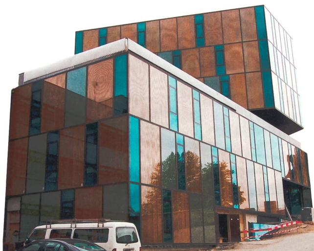
Figure 1 Nouveau bâtiment du Centre professionnel de Fribourg, entièrement vitré et à fort apport solaire passif. Différents types de vitrages sont mis en œuvre pour bénéficier au mieux de l'apport énergétique solaire.

Derrière les vitrages de couleur grise de la figure 1 sont disposés des panneaux translucides d'une épaisseur de 2 cm qui renferment un composant biphasique (liquide-solide). Il s'agit d'eau à très forte