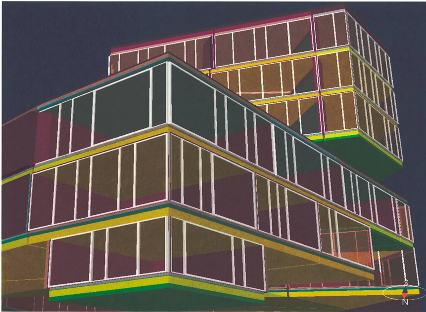
Figure 4 Visualisation graphique de la modélisation du comportement thermique du bâtiment avec le logiciel IDA ICE. Dans cette représentation 3D, la coloration correspond à une température (bleu = froid, rouge = chaud). Lors d'une simulation sur une période donnée, les couleurs évoluent avec la variation des températures et permettent de se rendre compte aisément si le niveau de confort fixé peut être garanti.

auxquelles il sera soumis dans les jours à venir. Il enrichit en permanence sa base de connaissance pour tendre vers un maximum d'efficacité. Avant sa mise en service, il a été entraîné grâce au modèle virtuel dans un mode de co-simulation.