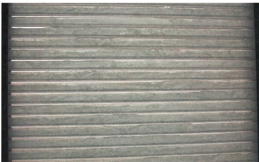
Figure 3 Panneau PCM (Phase Changing Material) disposé derrière le vitrage isolant pour atténuer les élévations de température dans la salle.

teneur en sel, qui cristallise lorsque la température passe en dessous de 24 °C et se liquéfie lorsque la température remonte au-dessus de cette limite. Durant le changement de phase solide-liquide, le panneau ( figure 3 ) accumule énormément d'énergie sans monter en température. Il modère ainsi l'échauffement du local durant les chaudes journées d'été. Durant la nuit, le panneau restitue son énergie et son contenu redevient solide. L'effet d'un panneau PCM (Phase Changing Material) de 2 cm est similaire à celui d'un mur de béton de 30 cm d'épaisseur.