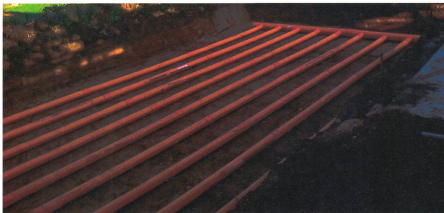
Figure 2 Exemple de puits canadien sous une maison familiale.