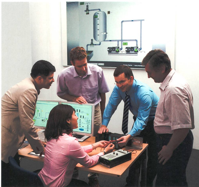
Figure 4 La sécurité ne peut être garantie que par une étroite collaboration entre l'exploitant et le fournisseur.

responsabilité quant au produit est donc clairement établie, bien que la question se pose quant à son applicabilité aux systèmes complexes d'aujourd'hui. A noter que la responsabilité du fabricant n'entre en jeu qu'en bout de course, lorsqu'il est déjà trop tard, qu'un dommage est apparu et que les conséquences économiques doivent être supportées.