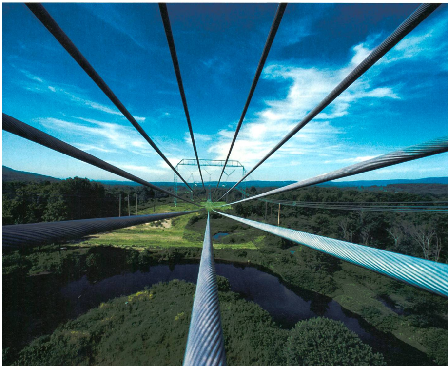
Figure 1 Les installations techniques ayant fait leurs preuves doivent relever le défi posé par l'utilisation de la technologie IT.

Extrêmement ingénieux, ce logiciel malveillant a probablement été développé par une équipe d'experts. Des compétences très particulières ont été nécessaires, à commencer par la connaissance des systèmes d'exploitation, de détails précis sur les appareils d'automatisation attaqués, de lacunes de sécurité alors inconnues, jusqu'à un savoir-faire très étendu et une connaissance de détails sur la configuration de l'installation particu-