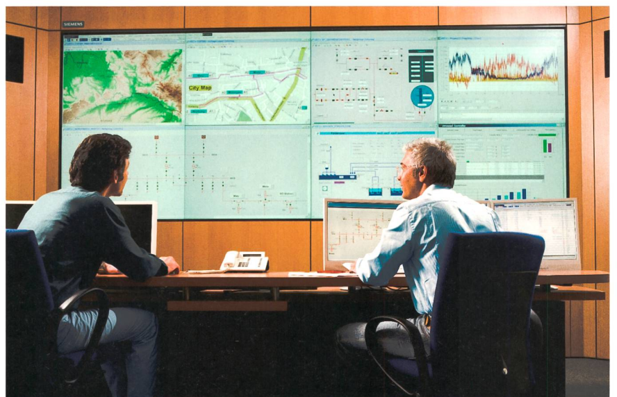
Figure 3 Des systèmes SCADA modernes sont essentiels à la sécurité de l'approvisionnement électrique.

Mais qui doit assumer la responsabilité de la sécurité d'une infrastructure critique? La réponse semble être évidente: l'exploitant en tant que propriétaire et utilisateur de l'installation est également responsable de la sécurité de ses systèmes. Cependant, le fabricant se retrouve toujours également impliqué. Sa