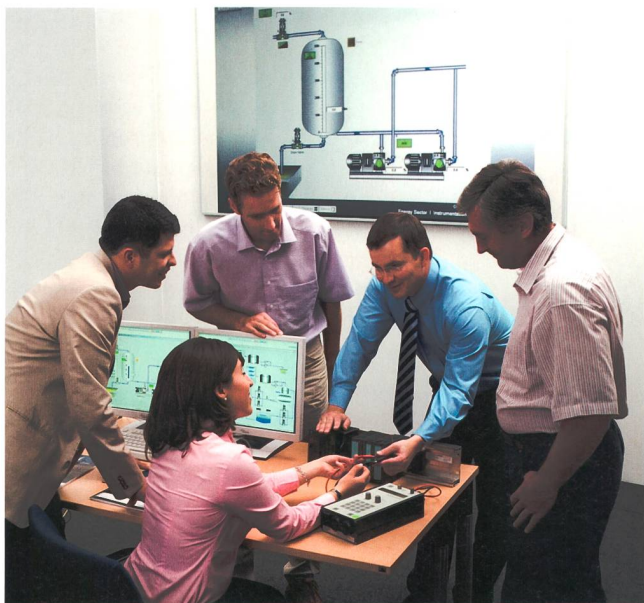
Figure 4 La sécurité ne peut être garantie que par une étroite collaboration entre l'exploitant et le fournisseur.

responsabilité quant au produit est donc clairement établie, bien que la question se pose quant à son applicabilité aux systèmes complexes d'aujourd'hui. A noter que la responsabilité du fabricant n'entre en jeu qu'en bout de course, lorsqu'il est déjà trop tard, qu'un dommage est apparu et que les conséquences économiques doivent être supportées.