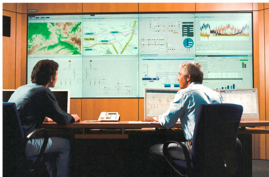
Figure 3 Des systèmes SCADA modernes sont essentiels à la sécurité de l'approvisionnement électrique.

Mais qui doit assumer la responsabilité de la sécurité d'une infrastructure critique? La réponse semble être évidente: l'exploitant en tant que propriétaire et utilisateur de l'installation est également responsable de la sécurité de ses systèmes. Cependant, le fabricant se retrouve toujours également impliqué. Sa