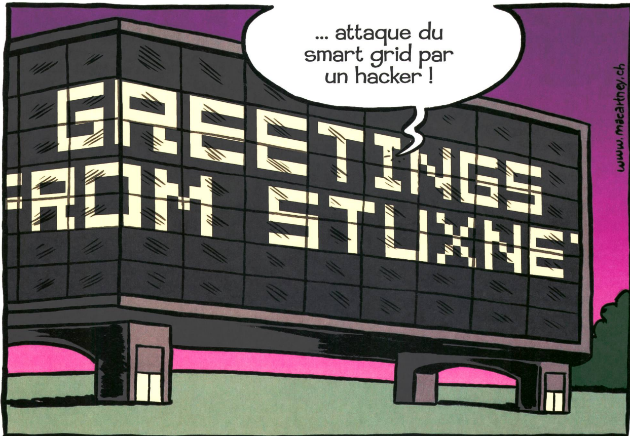
... Hackerangriff im Smart Grid!