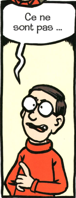
Das sind keine ...