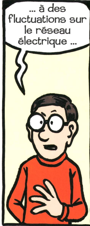
... Schwankungen im Stromnetz ...