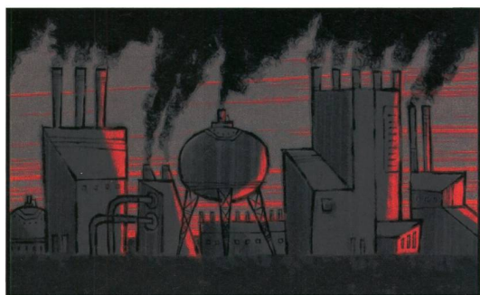
Figure 2 Une catastrophe écologique nous pend au nez si nous ne changeons pas rapidement nos habitudes.