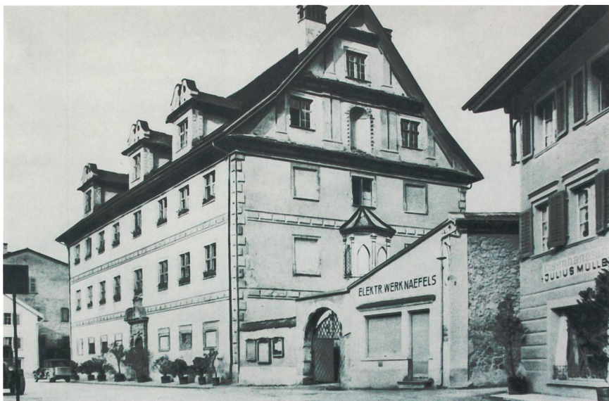
Das erste Kraftwerk eines Elektrizitätswerks im Kanton Glarus wurde 1890 im Freulerpalast in Näfels erstellt. Das Ladengeschäft des Elektrizitätswerks bestand bis in die 1930er-Jahre noch in einem Nebengebäude des Freulerpalastes.

Im Jahre 1901 wurde am Fätschbach in Linthal vom dortigen Elektrizitätswerk ein zweites grösseres Kraftwerk mit einer maximalen Leistung von 1000 PS in Betrieb genommen.