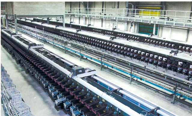
Trois des six machines de tri en fonction à Eclépens.