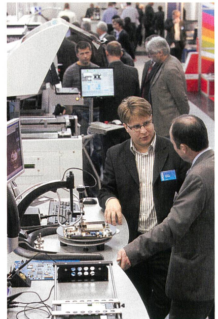
Moderne Herstellungsverfahren an der Productronica

Neben den Kernbereichen der Productronica – Leiterplatten- und Schaltungsträgerfertigung, Fertigungstechnologien in der Kabelverarbeitung, Bestückungstechnologie, Löttechnik und Mess- und Prüftechnik – präsentierte die