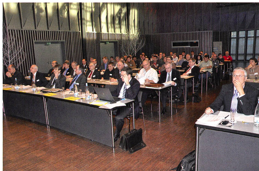
Über 100 Besucher nahmen an der Trafotagung in Baden teil.

Die Tagung war vielseitig und interessant. Die Präsentationen streiften auf kompetente, konzentrierte Weise ein breites Spektrum an relevanten Themen. Man stellte auch fest, dass bei Transformatoren nebst ökonomischen und technischen Aspekten, die nach wie vor zentral sind, auch ökologische Fragen eine zunehmend wichtige Rolle spielen, sei es nun in der Optimierung des Wirkungsgrads oder in der Verwendung von neuen, biologisch abbaubaren Isolierflüssigkeiten auf Basis pflanzlicher Öle. Radomir Novotny