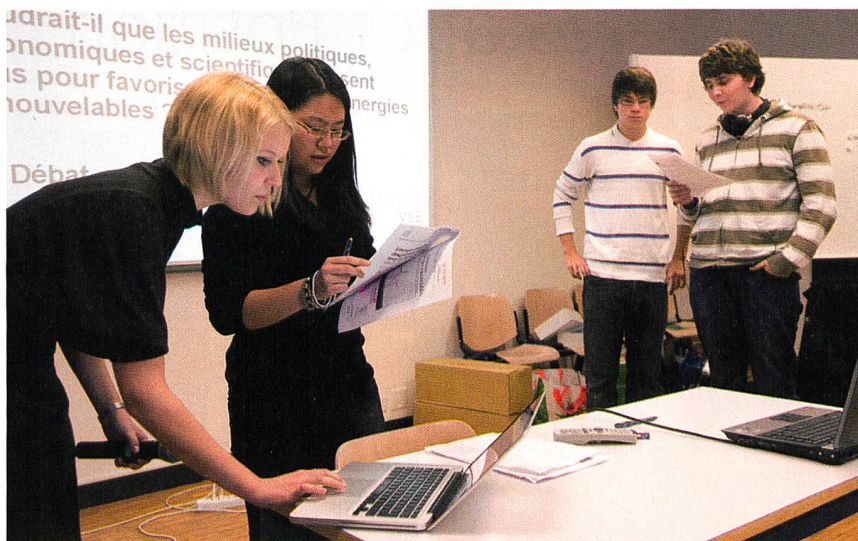
Un tandem de filles en train de se préparer pour un débat en plénum contre leurs deux camarades masculins.