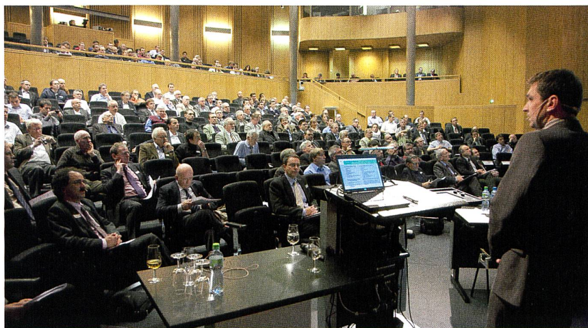
Die Eröffnungsveranstaltung war mit rund 250 Teilnehmern gut besucht.