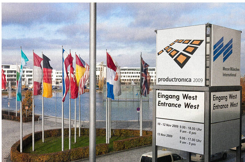
Die Productronica informiert Elektronikhersteller umfassend.

Dieses Treffen der Topentscheider der Branche wird künftig jährlich im Rahmen von Electronica und Productronica durchgeführt.