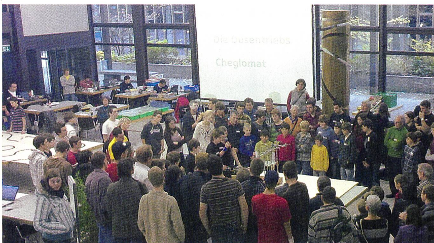
Team «Die Düsentriebs» während der Präsentation in der Kategorie Freestyle.