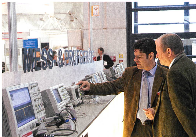
Mess- und Diagnosegeräte wurden vorgeführt.