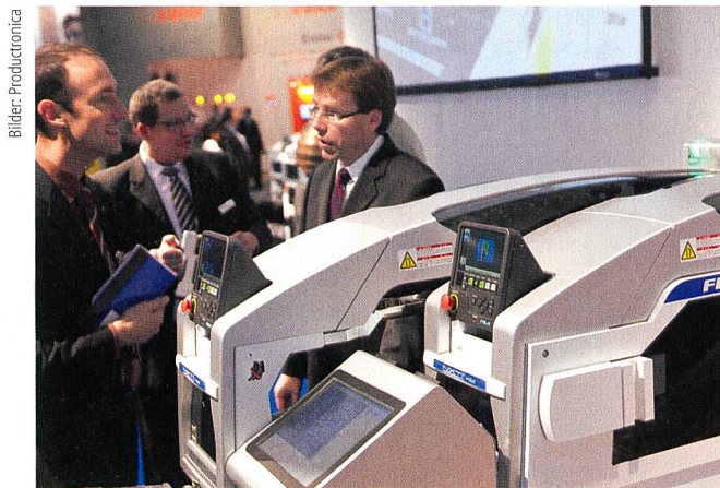
Hightech-Bestückungsautomaten waren auch vertreten.