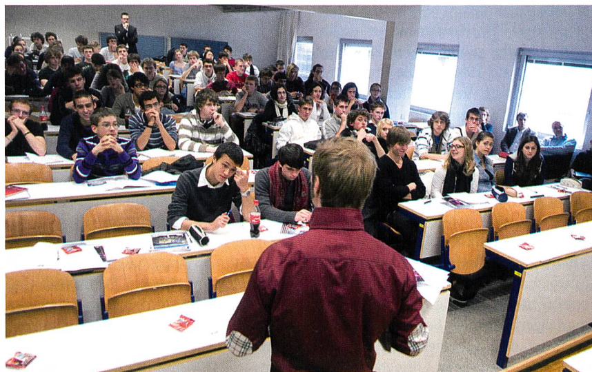
Toute la journée, les élèves ont été très intéressés par les explications des spécialistes de la branche.