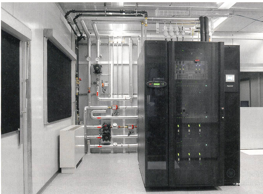
Bild 2 Der Supercomputer Aquasar im Maschinenlabor der ETH Zürich.