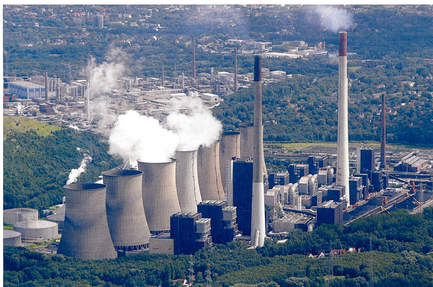
Jean-Marie Chevalier : « Les tarifs bloqués profitent au consommateur, mais n'incitent pas les investisseurs à financer de nouvelles centrales. »

La réponse à cette question appartient au Réseau européen des systèmes de