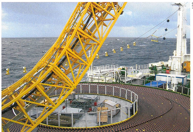
Die HGÜ-Kabel für den Stromtransport über das Meer werden mithilfe eines speziellen Verlegeschiffs auf dem Meeresboden platziert.

Obwohl die Desertec-Industrie-Initiative formell 2008 gegründet wurde, gehen ihre Ursprünge auf Pläne der Deutschen Gesellschaft Club of Rome (einer globalen «Ideenfabrik», die sich mit politischen Fragen und Themen wie Umweltschutz, Hunger, Wasserknappheit usw.