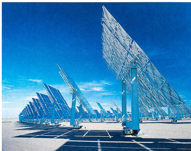
Bei grossen Solarparks folgen die beweglichen Solarmodule dem Stand der Sonne.

Ausserdem bietet die Verwendung von Turbinen die Möglichkeit, (wenn erforderlich) zusätzlichen Dampf durch Verbrennungsprozesse bereitzustellen, um Reserven aufzustocken oder gar ge-