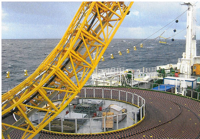
Die HGÜ-Kabel für den Stromtransport über das Meer werden mithilfe eines speziellen Verlegeschiffs auf dem Meeresboden platziert.

Obwohl die Desertec-Industrie-Initiative formell 2008 gegründet wurde, gehen ihre Ursprünge auf Pläne der Deutschen Gesellschaft Club of Rome (einer globalen «Ideenfabrik», die sich mit politischen Fragen und Themen wie Umweltschutz, Hunger, Wasserknappheit usw.