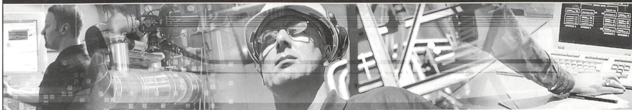
ABB ( www.abb.com ) ist weltweit führend in der Energie- und Automatisierungstechnik und beschäftigt in der Schweiz rund 6.000 Mitarbeitende.