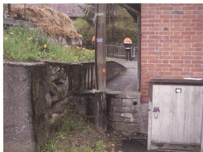
Mehrere Übungen werden 1:1 an einem realen Netz durchgeführt.

In Zusammenarbeit mit BKW FMB Energie AG wird der Verband Schweizerischer Elektrizitätsunternehmen wiederum 2 Kurse für Leitungskontrolleure mit Teilnehmenden aus dem gesamten deutschschweizerischen Raum und Lichtenstein durchführen.