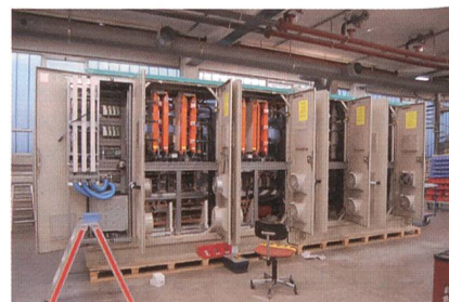
Schaltschrankmontage bei der Firma Simatex.

Die sich verändernden Betriebsbedingungen in den Netzen wie auch die steigenden Anforderungen bezüglich der Versorgungssicherheit bedingen den Einsatz von verschiedenen neuen Technologien. Die Netze müssen überwacht, gesteuert, automatisiert und dynamisiert werden. Die Aufgaben des Netzbetreibers nehmen stark zu und müssen beherrscht werden. Dazu wird die IT in der Sekundärtechnik zur Automatisierung und Rationalisierung eingesetzt.