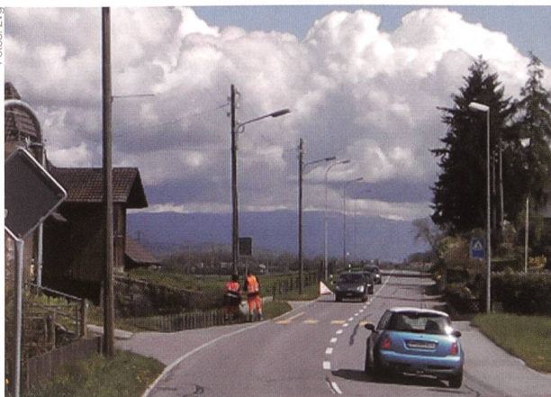
Team bei der Kontrolle an der Freileitung.