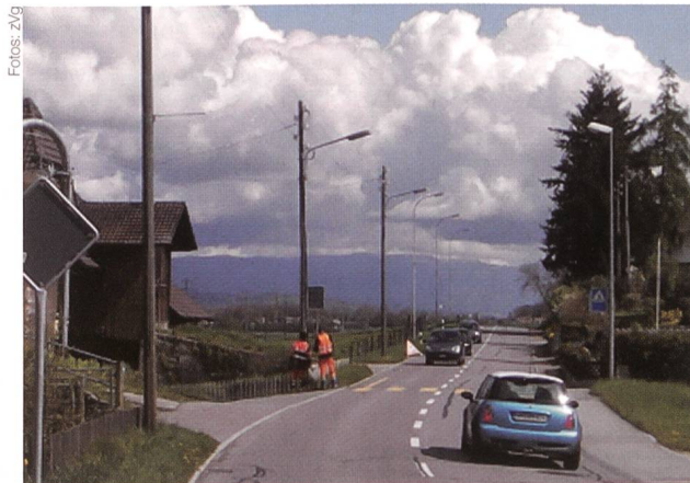
Team bei der Kontrolle an der Freileitung.