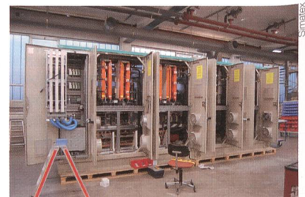
Schaltschrankmontage bei der Firma Simatex.

Die sich verändernden Betriebsbedingungen in den Netzen wie auch die steigenden Anforderungen bezüglich der Versorgungssicherheit bedingen den Einsatz von verschiedenen neuen Technologien.