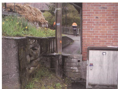
Mehrere Übungen werden 1:1 an einem realen Netz durchgeführt.

In Zusammenarbeit mit BKW FMB Energie AG wird der Verband Schweizerischer Elektrizitätsunternehmen wiederum 2 Kurse für Leitungskontrolleure mit Teilnehmenden aus dem gesamten deutschschweizerischen Raum und Lichtenstein durchführen.