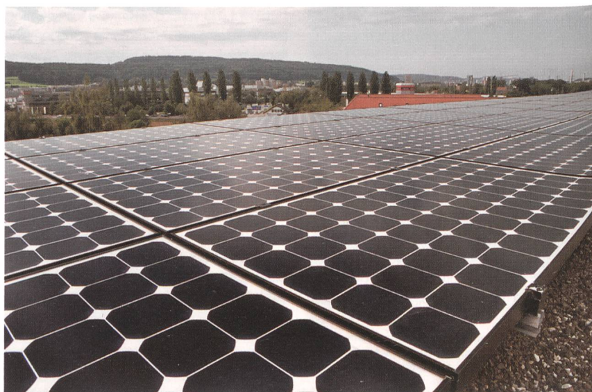
Das mehrfach preisgekrönte Hauptgebäude der Eawag: das Forum Chriesbach. Plusieurs fois primé – le bâtiment principal de l'Eawag: Forum Chriesbach.

Am 5. November werden die Tage der Technik 2009 im Auditorium Maximum der ETH Zürich eröffnet. Vorträge geben Ein-