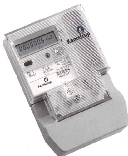
Zähler von Kamstrup: mit einem Eigenenergieverbrauch von nur 0,6 W macht er einen Unterschied.

La nouvelle armoire-cellule Hager univers de construction extralégère est un produit de qualité suisse d'une hauteur standard de 2000 mm disponible dans les pro-