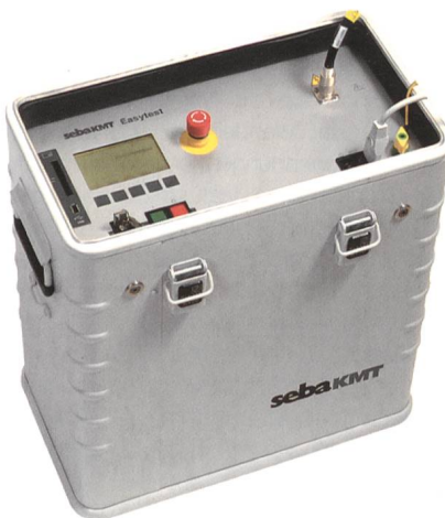
Kabelprüfgerät Easytester von Seba KMT.

Gemäss der BGV A3 (Berufsgenossenschaftliche Vorschrift für Sicherheit und Gesundheit bei der Arbeit) hat «... der Unternehmer dafür zu sorgen, dass elektrische