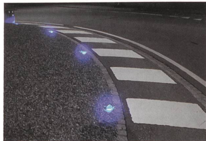
Circled-Einbauleuchten von Gifas sorgen für Sicherheit im Kreisverkehr.

Bei der Entwicklung der Circled-Einbauleuchte aus dem Hause Gifas wurde der Hauptfokus auf die Kreisverkehrsbeleuchtung gesetzt, wo die Leuchte als Sicherheits-, Leit- und Designlicht verwendet wird. Eingesetzt als Wegbeleuchtung für Boden- oder Wandeinbau und in vielen weiteren Anwendungen, erzeugt sie neben der Grundfunktion fast schon mystische Abstrahlungsmuster auf Boden und Wand. Erhältlich ist die Einbauleuchte mit verschiedenen Oberteilen, integrierter Lichtoptik sowie in verschiedenen Lichtfarben. Der Einsatz von neuester LED-Technologie und effizienter Elektronik sorgt für einen äusserst tiefen Stromverbrauch. Sämtliche Komponenten werden in der Schweiz hergestellt.