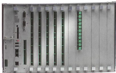
Feldgerät ME 4012 PAF von Mauell.

Für die dezentrale Stationsautomatisierung im Bereich der Hoch- und Höchstspannung bietet Mauell das Gerät ME 4012 PAF an. Ob als Feldgerät oder als Schaltfehlerschutz, sein modulares Systemkonzept ermöglicht die Anpassung an die jeweilige Aufgabenstellung und die Signalmüfänge. Ein- und Ausgabebaugruppen sind für die direkte Anschaltung von Binärsignalen bis 220 V DC, die Erfassung von Strom und Spannungswandler-Sekundärgrössen (1 A, 2 A, 5 A