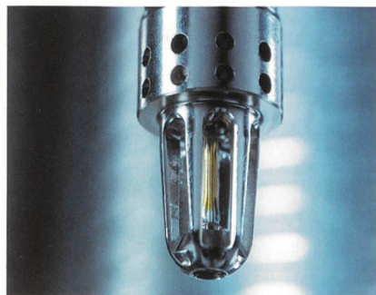
Hi-Fog-Anlagen von Contrafeu bekämpfen Brände mit Hochdruck.

Ein grosser Energieversorger hat für seine neue Trafostation die besonders dafür entwickelte Hi-Fog-GPU ausgewählt. Dieses Pumpenaggregat funktioniert ohne Fremdenergie und wird entweder durch Stickstoff oder Druckluft angetrieben.