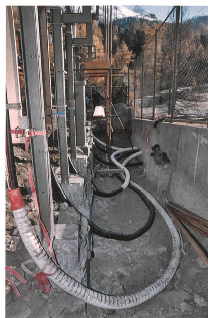
Hohe Belastbarkeit in anspruchsvoller Umgebung: Kabelschutzrohre von Symalit AG.

Die Produktpalette umfasst Noflam- und Chiaro-Kabelschutzrohre, Mehrfachrohre, flexible Kabelschutzrohre und Kabelschutzrohrbogen, Längverschluss-Kabelschutzrohre und -Bogen, DIL-Force-Kabel-