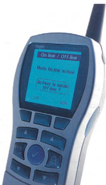
Le nouveau configurateur TX100B de Hager avec prise USB.

charger ensuite les données sur le chantier. En plus, le logiciel a été amélioré. En outre, il y a de nouvelles fonctions comme la numérotation manuelle des sorties, il est possible d'attribuer à une nouvelle entrée les paramètres et les liens d'une entrée déjà programmée. En cas de perte