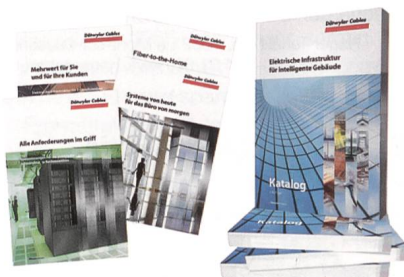
Übersichtlich und vollständig: der neue Katalog von Dätwyler Cables wird ergänzt durch mehrere Applikationsbroschüren.

Bei Dätwyler Cables ist ein neuer Gesamtkatalog erhältlich, der auf über 500 Seiten einen Überblick über alle Produkte und Lösungen des Herstellers für die elektrische Gebäudeinfrastruktur bietet. Die neue Ausgabe ist vollständig überarbeitet, um zahlreiche Neuentwicklungen ergänzt, auf den jüngsten Normungsstand gebracht und übersichtlicher gegliedert. Investoren, Planern, Installateuren und allen Interessierten stehen ausserdem mehrere Applikationsbroschüren zur Verfügung, darunter