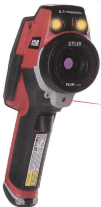
Flir erweitert die Produktlinie der Einstiegs-Infrarotsysteme.

Flir erweitert ihre i-Serie mit der Wärmebildkamera i40. Die Kameras richten sich sowohl an Einsteiger als auch an erfahrene Thermografen im täglichen Einsatz, um Probleme an elektrischen Anlagen aufzudecken, mechanische Störungen zu ermitteln, vorbeugende Wartungsmassnahmen auszuführen und Energie zu sparen.