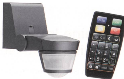
Bewegungsmelder EE871 von Hager mit IR-Fernbedienung.

Die Geräte der Komfortklasse in Weiss, Anthrazit und Alu besitzen einen Erfassungsbereich von 220–360°, der mit schiebbaren Abdeckstreifen angepasst werden kann. Die maximale Leistung erreicht 16 A (2300 W). Dank dem potenzialfreien Kontakt können diese Melder auch in