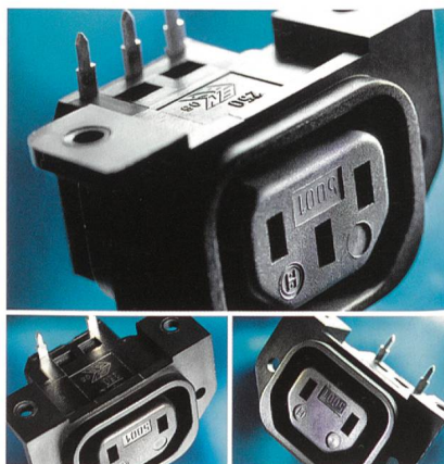
Geräteeinbausteckdose 5001 von Schurter für Leiterplattenmontage.

Die Serie 5001 ist in Schutzklasse I (3-polig) und II (2-polig) erhältlich. Der Erdkontakt der Schutzklasse I verfügt über einen