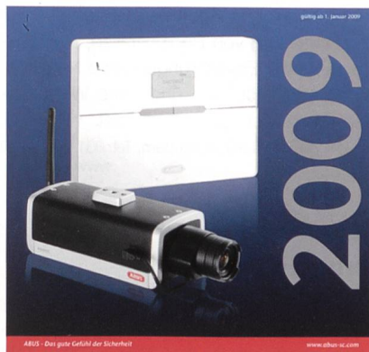
Viele Produktneuheiten im Katalog von Trigress Security.

Die ganze Welt der Videoüberwachung & Alarmtechnik – nur für den Fachhandel