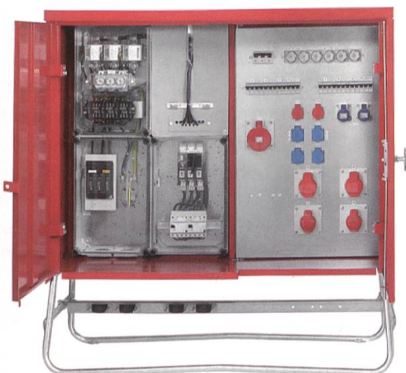
Vorbereitet und ausgerüstet für Wandlermessung: die neuen Baustromverteiler von Demelectric.

Für die Umrüstung von Schweizer Industriesteckdosen auf das EU-Steckverbindingssystem CEE bietet Demelectric vor-