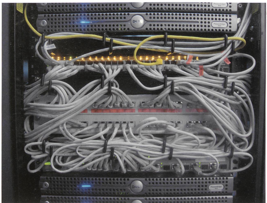
Bild 3 Ethernet-basierte Netzwerkinfrastruktur.

Dritte Annahme: Schlüsselverwaltungen auf der Basis einer PKI sind realisiert. Diese Art der Infrastruktur einer Sicherheitsunterstützung hat deutlich an Bedeutung und in der Anzahl existierender Installationen und deren Anwendung zugenommen [6]. Auch ist der Einsatz in anderen kommerziellen Bereichen stark, d.h., ein Synergieeffekt aus dem Einsatz mittels TunelnNet im Netzwerkbereich ist zu erwarten. Allerdings