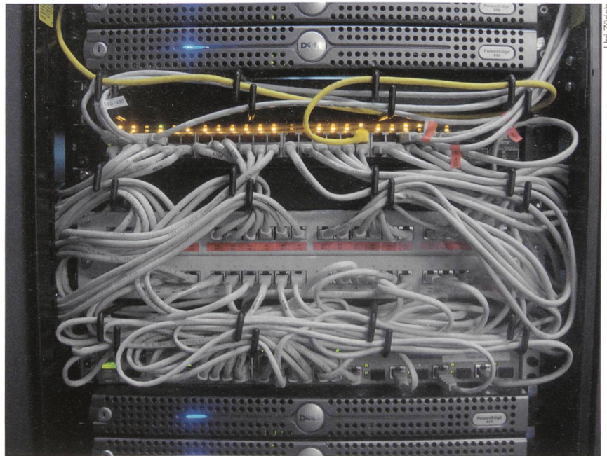
Bild 3 Ethernet-basierte Netzwerkinfrastruktur.

Dritte Annahme: Schlüsselverwaltungen auf der Basis einer PKI sind realisiert. Diese Art der Infrastruktur einer Sicherheitsunterstützung hat deutlich an Bedeutung und in der Anzahl existierender Installationen und deren Anwendung zugenommen [6]. Auch ist der Einsatz in anderen kommerziellen Bereichen stark, d.h., ein Synergieeffekt aus dem Einsatz mittels TunelnNet im Netzwerkbereich ist zu erwarten. Allerdings