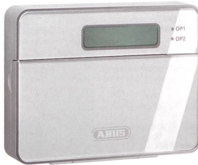
GSM-Wählgerät Terxon von Trigrass Security.

Mit dem neuen Terxon-GSM-Wählgerät von Trigrass Security werden Alarmmeldungen als Sprachtexte und als SMS-Nachrichten über Festnetz und Mobilfunk an bis zu 10 Telefonnummern gesendet.