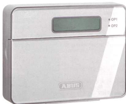
GSM-Wählgerät Terxon von Trigrass Security.

Mit dem neuen Terxon-GSM-Wählgerät von Trigrass Security werden Alarmmeldungen als Sprachtexte und als SMS-Nachrichten über Festnetz und Mobilfunk an bis zu 10 Telefonnummern gesendet.