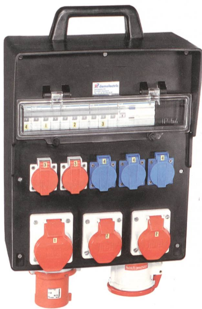
63-A-Baustromverteiler von Demelectric.

858 und 819 angesiedelt. Auch das Kunststoff-Stromverteilersortiment wurde um 2 Varianten ergänzt. Der Typ 909 mit Zweifachgehäuse bietet nebst 5 FI-geschützten und LS-gesicherten Steckdosen Platz für zusätzliche Reiheneinbaugeräte.