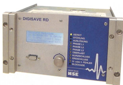
Schutztechnik von NSE, damit die Lichter nicht ausgehen.

Für die Analyse von Mittelspannungsnetzen werden modernste dynamische Berechnungswerkzeuge eingesetzt, die Ergebnisse werden in verständlicher Form in geografischen Übersichtsplänen dargestellt. Die periodische Prüfung von Schutzrelais und Schutzsystemen in den Trafostationen wird vor Ort mit automatischen Prüfungssystemen und kundenspezifischen Prüfroutinen durchgeführt. Dadurch werden kurze Prüfzeiten mit geringen Netzabschaltungen in den Trafostationen ermöglicht, und die lückenlose Dokumentation der