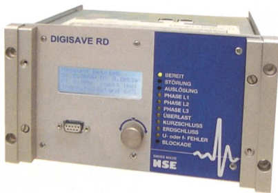
Schutztechnik von NSE, damit die Lichter nicht ausgehen.

Für die Analyse von Mittelspannungsnetzen werden modernste dynamische Berechnungswerkzeuge eingesetzt, die Ergebnisse werden in verständlicher Form in geografischen Übersichtsplänen dargestellt. Die periodische Prüfung von Schutzrelais und Schutzsystemen in den Trafostationen wird vor Ort mit automatischen Prüfungssystemen und kundenspezifischen Prüfroutinen durchgeführt. Dadurch werden kurze Prüfzeiten mit geringen Netzabschaltungen in den Trafostationen ermöglicht, und die lückenlose Dokumentation der