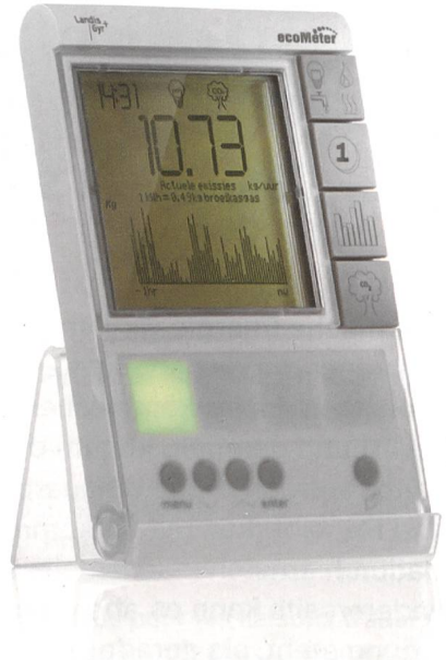
EcoMeter - Landis+Gyr

Das Kommunikationsmodul ist steckbar und kann somit jederzeit den neuesten Anforderungen der Telekommunikation angepasst werden, deren Technologie sich in deutlich kürzeren Zyklen erneuert als die Zählertechnik.