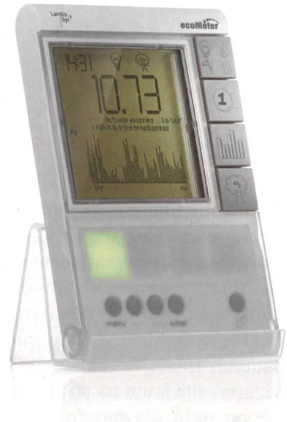
Bild 3 Beispiel eines In-Home-Displays.

Das Kommunikationsmodul ist steckbar und kann somit jederzeit den neuesten Anforderungen der Telekommunikation angepasst werden, deren Technologie sich in deutlich kürzeren Zyklen erneuert als die Zählertechnik.