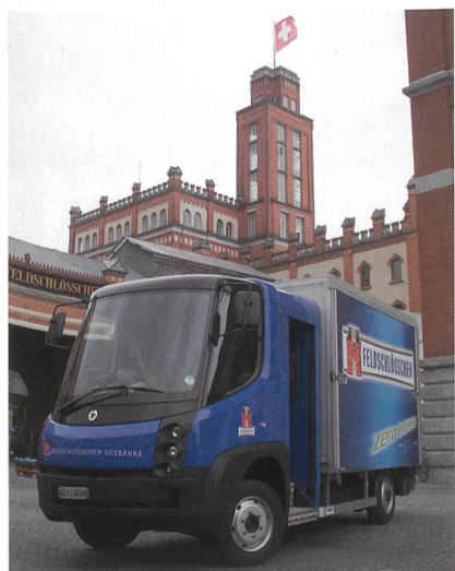
Passanten gucken zweimal, wenn der Elektrolastwagen vorbeifährt.

UMB sollte der Nachfolger für die Übertragungstechnologie CDMA 2000 werden, die unter anderem in den USA genutzt wird, beispielsweise vom zweitgrössten US-Mobilfunkanbieter Verizon Wireless. Doch auch LTE ist als Upgrade entsprechender Netzwerke geeignet, und gerade Verizon hatte im September 2007 angekündigt, dass es LTE als 4G-Technologie nutzen will. «Mit Verizons Entscheidung zugunsten von LTE war klar, dass UMB tot ist», meint Milanesi. Da mit Qualcomm nun auch der Hauptentwickler der Technologie ins Lager des UMTS-Nachfolgers wechselt, ist das Ende vom UMB wohl endgültig besiegelt. (Presstext Schweiz/gus)