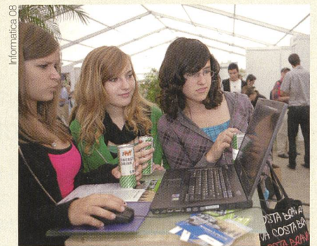
Die Jungen – und Mädchen – interessieren sich für Informatik.