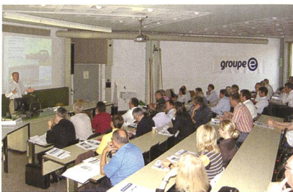
Rund 60 Besucher beschäftigten sich an der E'mobile-Tagung mit effektiven und umweltfreundlichen Fahrzeugkonzepten.

Eine Aufgabe, die lediglich am Rande erwähnt wurde, ist das schnelle Laden von leistungsfähigen Batterien der nahen Zukunft. Dafür wird es eine Anschlussleistung in der Grössenordnung eines Einfamilienhauses brauchen. Bis ein entsprechendes Netz von Ladestationen zur Verfügung steht, müssen noch einige Probleme gelöst werden. (E'mobile/Cke)