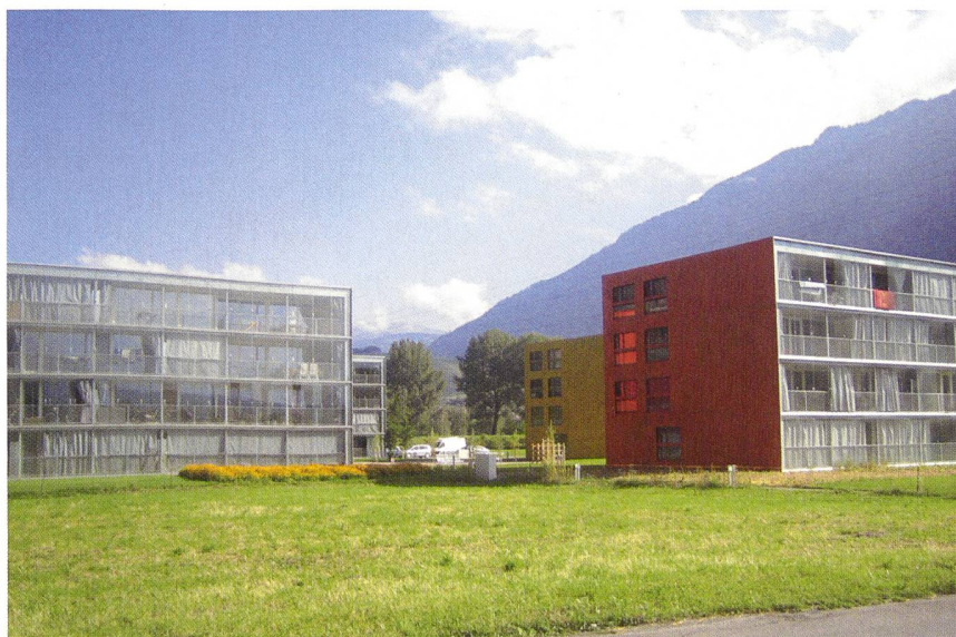
Développement d'un quartier Minergie raccordé à un réseau de chaleur à St-Maurice.

Les choix d'aménagement, d'urbanisme, d'occupation des sols et de mobilité déterminent en grande partie ce que seront en définitive les consommations énergétiques de tous les acteurs de la ville pour leur loge-