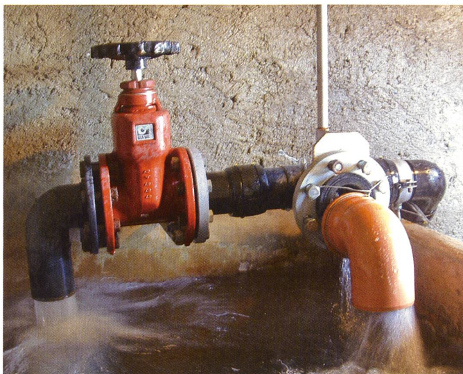
Interconnecter les réseaux d'eau dans les Alpes pour valoriser les surplus.

La Ville de Martigny a récemment décidé de réaliser un avant-projet urbain de réhabilitation d'une ancienne friche industrielle [4]. L'objectif est de réaliser un quartier résidentiel d'une vingtaine de bâtiments de tailles et d'affectations différentes dont la surface dépasserait les 35 000 m 2 . La dimension de ces infrastructures va naturellement entraîner une importante consommation de ressources. Les élus locaux ont donc décidé d'analyser en détail la problématique énergétique/climatique en s'appuyant sur la vision de la «Société à 2000 Watt». Le choix de technologies de conditionnement exigeant de basses températures, la centralisation de la production de chaleur et la création d'un réseau de quartier, l'orientation des toits permettant une implantation optimale de capteurs photovoltaïques, sont autant d'actions devant à l'avenir favoriser le développement des énergies renouvelables.