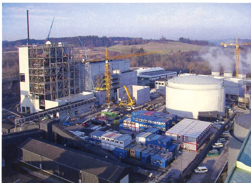
Construction de la centrale à cycle combiné (gaz et vapeur) à Timelkam (Autriche).