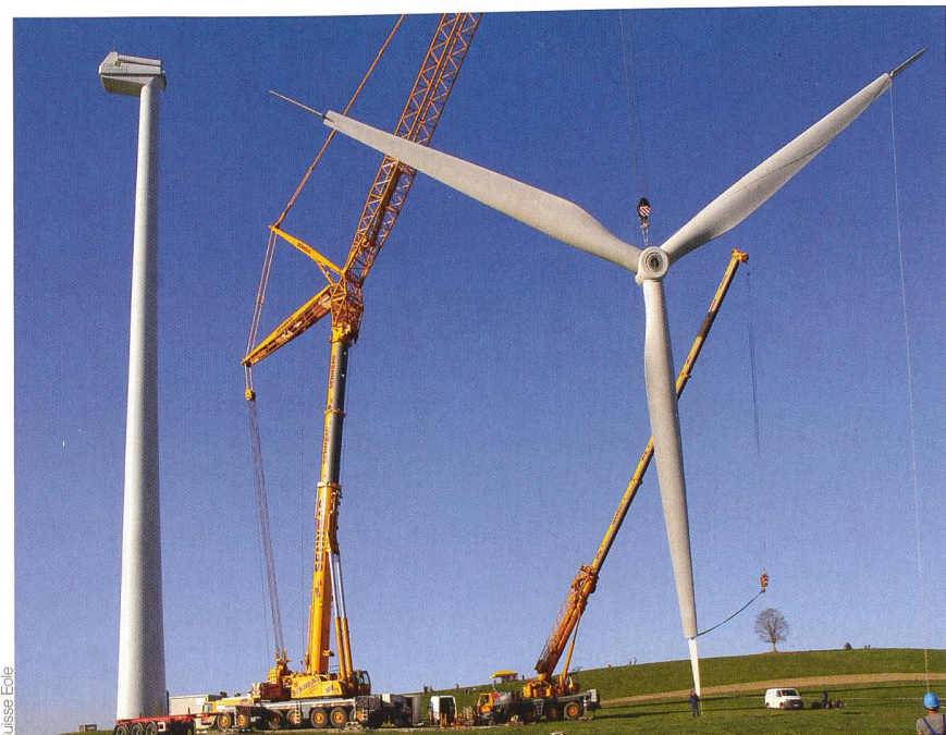
Bei einer Anlage im Entlebuch wird der Rotor angebracht.

Die Windenergie boomt weltweit. Daher steht den positiven Voraussetzungen in der Schweiz aktuell der Produktionsengpass von Windturbinen gegenüber. Die Turbinen werden vorwiegend in Deutschland und Dänemark produziert. Der Engpass führt zu Wartefristen von bis zu zwei Jahren und treibt die Preise in die Höhe. Diese werden für die Schweizer Projektinitiatoren durch den starken Euro zusätzlich erhöht. Aus diesem Grund habe die Suisse Eole während der Vernehmlassung zur Änderung