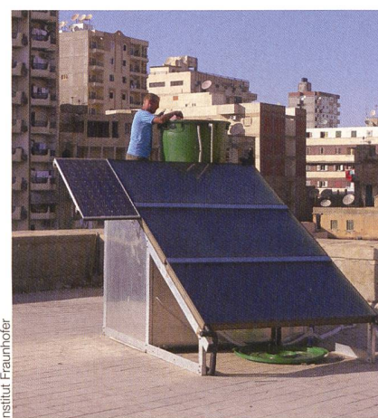
Les installations décentralisées de dessalement à alimentation autonome en énergie pourraient être utilisées surtout dans l'approvisionnement en eau potable de régions à faible infrastructure et produire environ 1000 litres pour 10 euros.

Les coûts de 1 m 3 d'eau potable seraient d'environ 10 euros, ce qui est intéressant