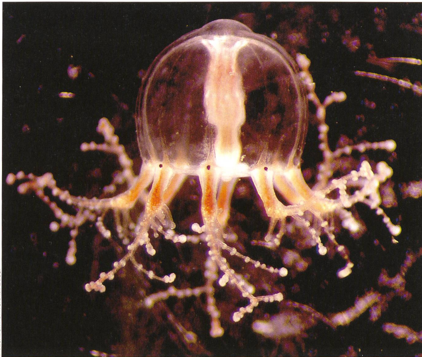
Biozentrum Universität Basel

Die Augen der Hydromeduse Cladonema radiatum befinden sich an der Basis der Tentakeln (dunkle Punkte).