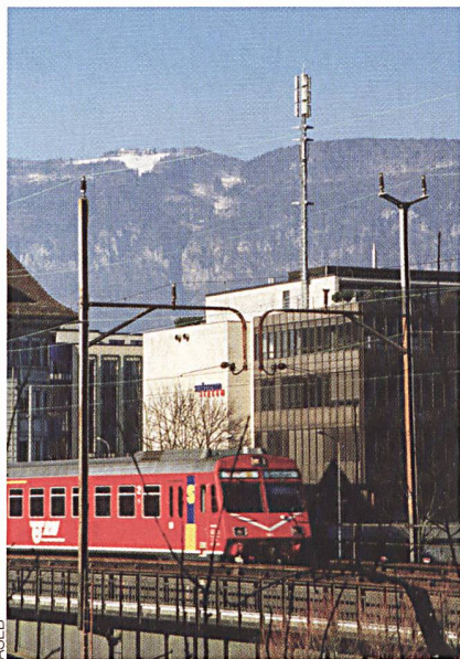
Bild 4 Für ortsfeste Quellen nicht ionisierender Strahlung sind Grenzwerte definiert. Nicht so für die meisten Quellen, die in Haushaltungen verbreitet sind.

Die Empfehlungen reichen von 2 W/kg der internationalen Kommission für den Schutz vor nicht ionisierender Strahlung (ICNIRP), die sich an der thermischen Wirkung orientiert, bis zu weniger als 0,2 W/kg von Mobilfunkkritikern, die potenzielle Risiken mitberücksichtigen. Die SAR-Werte finden sich in den Bedienungsanleitungen der Mobilfunktelefone. Bei Röhrenbildschirmen deutet der schwedische Qualitätsstandard TCO (aktuell TCO03) auf einen strahlungsarmen Bildschirm hin.