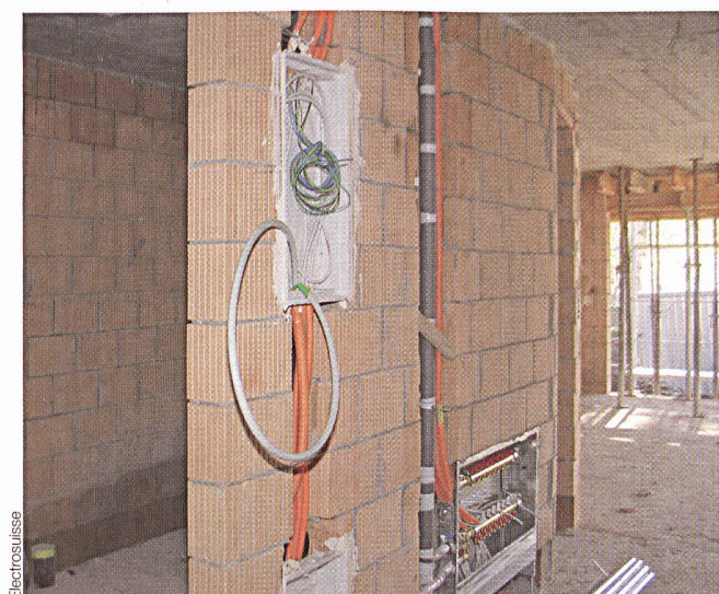
Bild 3 Leitungen und Steigzonen sollten im Bereich von Ruhezonen – beispielsweise Schlafzimmer – vermieden werden.

Hausgemachte elektromagnetische Felder verursachen oft stärkere Belastungen als die ausserhalb unseres Einflussbereichs liegenden Quellen. Haartrockner, Staubsauger, Mikrowellen- und Kochherde – um nur einige zu nennen – erzeugen in unmittelbarer Nähe starke Magnetfelder. Diese Magnetfelder nehmen mit zunehmender Distanz rasch ab. Zudem sind wir den Belastungen solcher Geräte im Allgemeinen nur kurzfristig ausgesetzt, weil sie nicht ständig im Einsatz stehen. Dagegen ist bei lang andauernd betriebenen Elektrogeräten wie Radiowecker, Niedervolt-Halogenlampen, aber auch bei den diversen Gerätetransformatoren, zum Beispiel von Laptops oder Ladestationen, darauf zu achten, dass ein genügend grosser Abstand von zirka einem Meter zu empfindlichen Zonen wie Bett, Büro und Ruhezone eingehalten wird. Die Abstandsregel gilt auch in Nachbarzimmern, da Magnetfelder praktisch ungehindert Wände durchdringen. Diesem Umstand ist insbesondere bei der Installation von Geräten wie Boilern, Kühlschränken