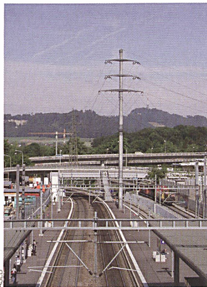
Bild 1 Wo Strom fliesst, entstehen elektromagnetische Felder – Elektrosmog.

Die Schweiz regelt den Umgang mit ortsfesten Anlagen, die NIS erzeugen, in der Verordnung über den Schutz vor nicht ionisierender Strahlung (NISV), die im Februar 2000 in Kraft gesetzt worden ist. Sie basiert auf dem Umweltschutzgesetz und regelt den Bereich von 0 bis 300 GHz. Mit Immissionsgrenzwerten, die überall einzuhalten sind, wird sichergestellt, dass niemand aufgrund der wissenschaftlich anerkannten Auswirkungen gesundheitlichen Schaden erleidet. Wegen der bestehenden Unsicherheiten bezüglich der gesundheitlichen Auswirkungen und aufgrund des Vorsorgeprinzips wurden an denjenigen Orten, an denen sich Menschen lange Zeit aufhalten, strengere, sogenannte Anlagegrenzwerte festgelegt. Diese sind namentlich in Wohnräumen, an Arbeitsplätzen, in Schulräumen und auf raumplanungsrechtlich festgelegten Kinderspielflächen einzuhalten. Die Anlagegrenzwerte liegen etwa um einen Faktor 10 im hochfrequenten und um einen Faktor 100 im niederfrequenten Bereich unter den Immissionsgrenzwerten. Da es keine abschliessenden wissenschaftlichen Erkenntnisse gibt, ob bei der Exposition unterhalb dieser Anlagegrenzwerte ein