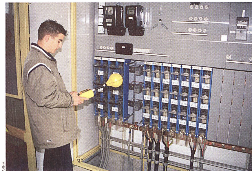
Bild 2 Magnetfeldmessung beim Elektroverteiler.

Gesundheitsrisiko besteht oder nicht, sind diese Grenzwerte umstritten.