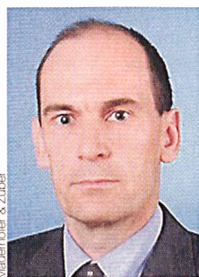
Mauerhofer & Zuber