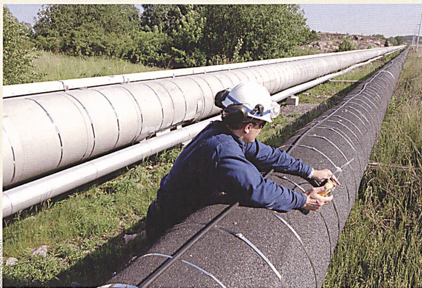
Le réseau suisse de gaz naturel a gagné plus de 200 km.

Le gaz naturel est bon à tout faire. Il est utilisé comme combustible, mais aussi de plus en plus comme carburant. Il apporte une contribution importante à la réalisation des objectifs arrêtés par la Suisse en matière de lutte contre la pollution et, en particulier, contre les émissions de CO 2 provoquées par la consommation d'énergie. En Suisse, la part du gaz naturel à la consommation finale globale d'énergie est maintenant constamment supérieure à 12%. (ASIG/kl)