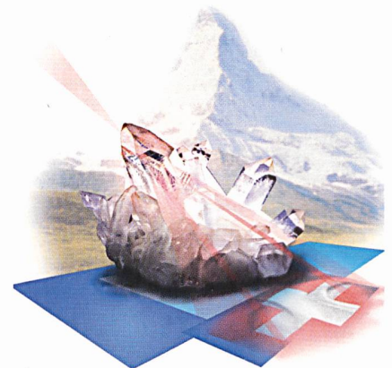
Netzbewertung mit Software von Encontrol

Encontrol GmbH, 5443 Niederrohrdorf, Tel. 056 485 90 44, www.encontrol.ch