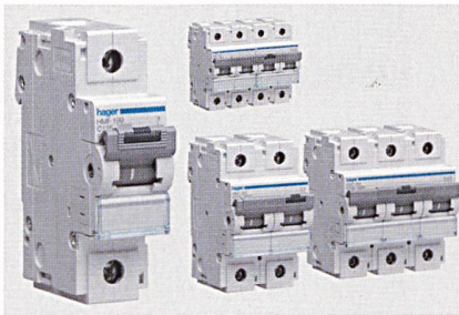
Die neuen Leitungsschutzschalter PPR175 für 80 bis 125 A von Hager

Die neuen ein- bis vierpoligen Leitungsschutzschalter PPR175 von Hager bewältigen Stromstärken von 80 bis 125 A. Die Geräte verfügen über eine hohe Abschaltleistung, die TCS-Klemme und eine integrierte Abschliessvorrichtung. Sie haben ein Nennausschaltvermögen von 15 kA, begrenzen den Strom und schalten vor dem Nulldurchgang der Sinuswelle. Die Auslösecharakteristik liegt bei C und D bei minimaler Verlustleistung. Fehlerströme werden durch anbaubare FI-Blöcke verhindert. Sämtliche Zusatzeinrichtungen wie Hilfskontakte können aus dem Standardsortiment verwendet werden. Mit der Abschliessvorrichtung lassen sich die abgeschalteten Geräte schnell und einfach verriegeln. Dadurch ist es unmöglich, die Leitungsschutzschalter versehentlich einzuschalten.