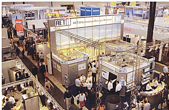
Intersolar 2007 findet zum letzten Mal in Freiburg i.B. statt.

Solar Promotion GmbH, D-75101 Pforzheim, Tel. 0049 7231-58598-0, Internet: www.intersolar.de .