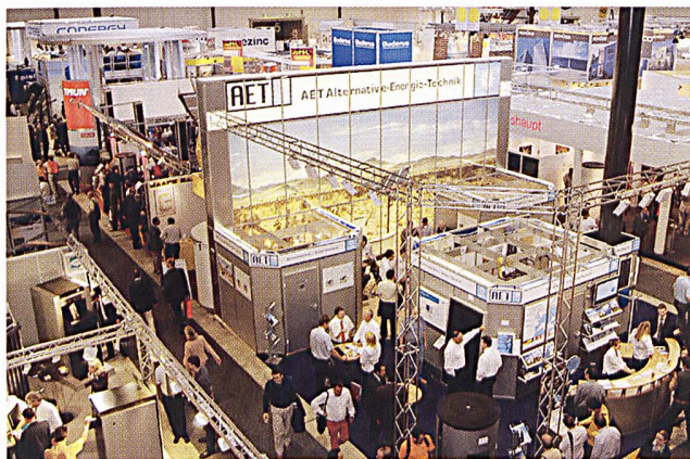
Intersolar 2007 findet zum letzten Mal in Freiburg i.B. statt.

Solar Promotion GmbH, D-75101 Pforzheim, Tel. 0049 7231-58598-0, Internet: www.intersolar.de .