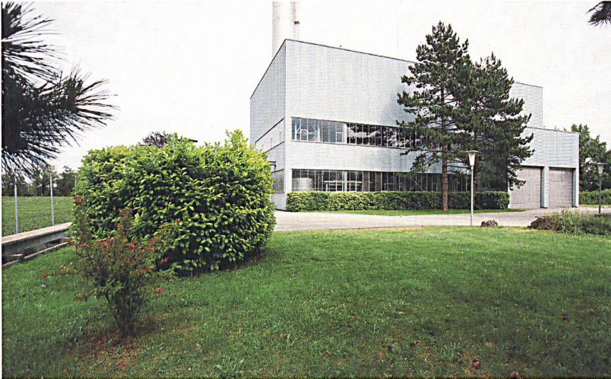
Centrale thermique actuelle de Cornaux.

La construction d'une centrale au gaz à Cornaux va contribuer concrètement à la sécurité d'approvisionnement des clients de Groupe E et renforcer sa position de producteur d'énergie.