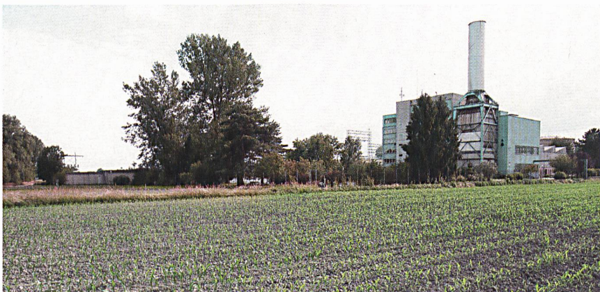
Centrale thermique de Cornaux aujourd'hui.

Groupe E désire compenser une bonne partie des émissions de CO 2 de la nouvelle centrale dans le but d'être exempté de la taxe. Une exemption est possible avec des mesures volontaires de compensation à négocier avec les Offices de l'Environnement et de l'Énergie. Les compensations des émissions sont cependant difficiles à réaliser car les projets entrant en ligne de compte sont restreints et doivent rester économiquement supportables pour l'entreprise. De plus, les règles du jeu n'étant pas encore clairement définies en Suisse, cela pourrait devenir hautement pénalisant par rapport aux concurrents européens. Le grand souci de Groupe E est de fournir de l'énergie aux particuliers et aux entreprises à des prix compétitifs pour garantir des conditions favorables au développement économique des cantons Fribourg et Neuchâtel.